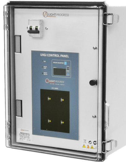
TABLE - Tabella